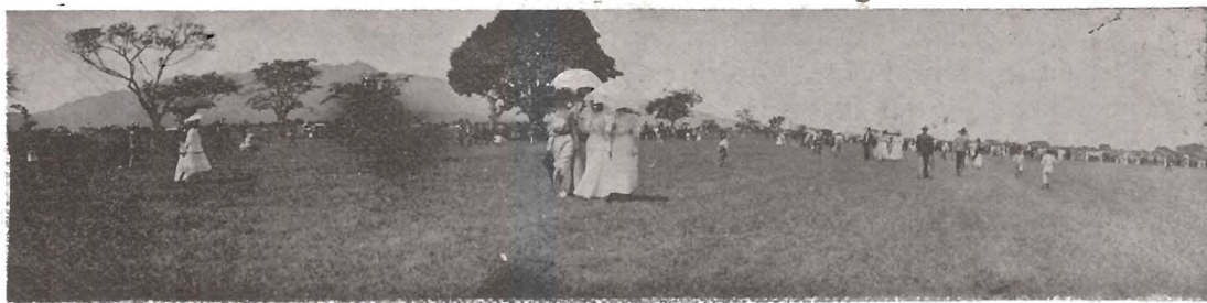
EN LA SABANA.—Partida de Foot Ball entre los Clubs La Juventud y La Libertad, celebrado el día 15 de setiembre, en la cual obtuvo el triunfo el primero por 5 «goals» contra uno.